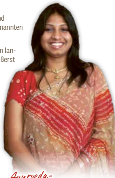
Ayurveda-Therapeuten vor Ort

Die von uns angebotenen Anwendungen sind keine medizinische Therapie, von uns werden keine Diagnosen gestellt oder Heilversprechen gegeben. Die Anwendungen ersetzen keinen Arztbesuch und erfolgen auf eigene Verantwortung. Im Zweifelsfalle kontaktieren Sie bitte vorher Ihren Arzt.